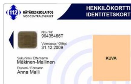
Kuva 1. Vakio-organisaatiokortti

Vakio-organisaatiokortin korttiaihion visuaalinen ulkoasu muodostuu liukuvan sinisestä tai valkoisesta pohjaväristä. Organisaation nimi sekä organisaation logo tulevat organisaatiokortin yläosaan. Organisaatiokortin etupuolelle tulevia tekstin ns. ohjauksentäviä ovat kortin sarjanumero, viimeinen voimassaolopäivä, sukunimi ja etunimi sekä valinnaisena saatavissa oleva kenttä, johon voidaan laittaa organisaatio, organisaatioyksikkö tai toimenkuva. Kortti voi olla kuvallinen tai kuvaton. Henkilön kuva sijoitetaan oikeaan laitaan. Vakio-organisaatiokortti on saatavissa myös pystymallina. Vakio-organisaatio-kortti tuotetaan kokonaisuudessaan pintatulostustekniikalla.