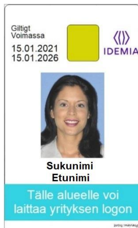
Kuva 9: Korttipohja 5 edestä