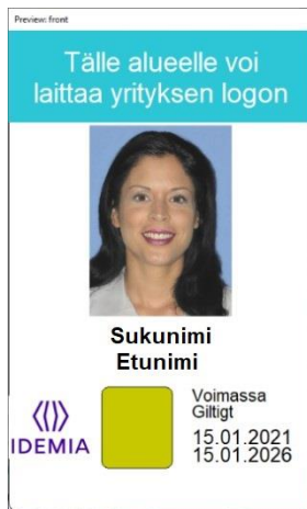
Kuva 7: Korttipohja 4 edestä