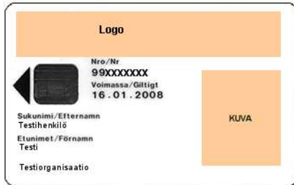
Figur 11 Standardorganisationskort, exempel 1