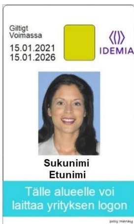
Figur 9 Kortmall 5 baksida