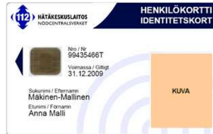
Figur 12 Standardorganisationskort, exempel 2

Standardorganisationskortet har vit grundfärg. Kortet produceras i sin helhet med ytutskriftsteknik. Texten som kommer på organisationskortets framsida, s.k. styrfält, är kortets serienummer, sista giltighetsdag, förnamn och efternamn samt ett valfritt fält där man kan ange organisation, organisationsenhet eller titel. Kortet kan vara med eller utan bild. Kortet finns också som vertikal modell.