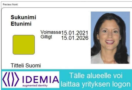
Figur 5 Kortmall 3 framsida