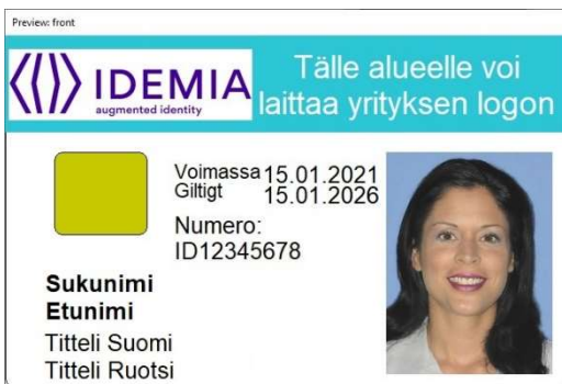
Figur 1 Kortmall 1 baksida

MDB erbjuder ett kortläsarprogram för operativsystemen Windows, macOS och Linux.