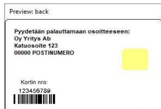
Figur 4 Kortmall 2 baksida