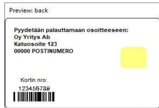
Figur 6 Kortmall 3 baksida