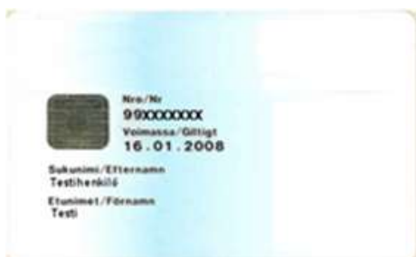
Figur 13 Certifikatkort

Den visuella specificeringen av kortets fram- och baksida är färdigt bestämd. Kortet förses inte med en organisationens logo eller ett personfoto. Kortets framsida produceras med samma grunddefinitioner som standardorganisationskortet i punkt 2.1.2. På framsidan visas kortets serienummer, sista giltighetsdag, personens förnamn och efternamn samt som option ett fält med titel, organisationsenhet eller organisation. På baksidan av kortet finns en returadress och en returadress enligt beställningsmaterialet