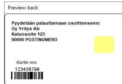
Figur 4: Kortmall 2 baksida