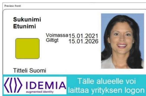
Figur 5: Kortmall 3 framsida