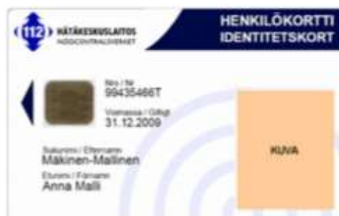
Figur 12 Standardorganisationskort 2