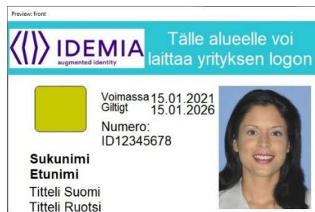
Figur 1: Kortmall 1 framsida

När en färdig kortmall används är avgiften för att grunda en korttyp 800 euro per kortpro-dukt. Ingen separat årlig avgift för kortunderhåll debiteras. Priset för en kortmall utan foto är 15 euro per kort och för en kortmall med foto 19 euro per kort. För varje kort debiteras dessutom en årlig certifikatavgift på 6,90 euro per år per kort.