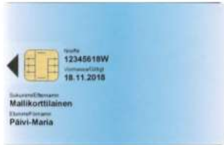
Figur 13 Certifikatkort