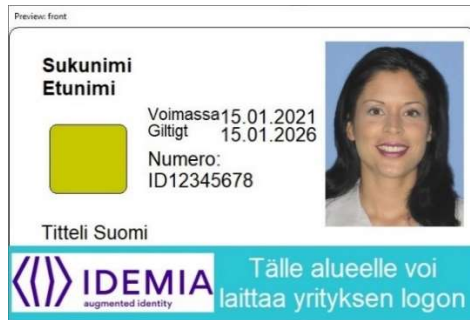
Figur 3: Kortmall 2 framsida