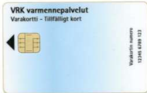
Figur 14 Tillfälligt kort