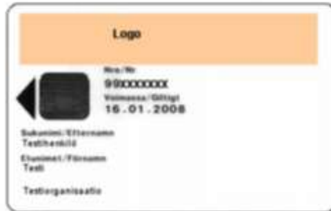
Figur 11 Standardorganisationskort 1