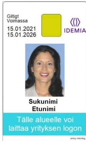
Figur 9: Kortmall 5 framsida