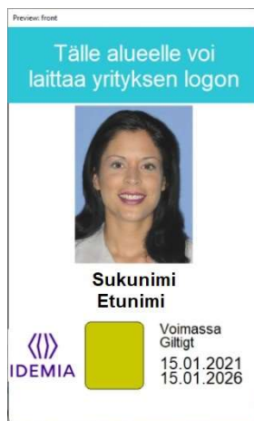
Figur 7: Kortmall 4 framsida