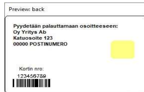
Figur 6: Kortmall 3 baksida