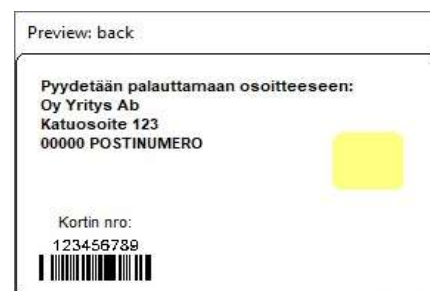
Figur 2: Kortmall 1 baksida