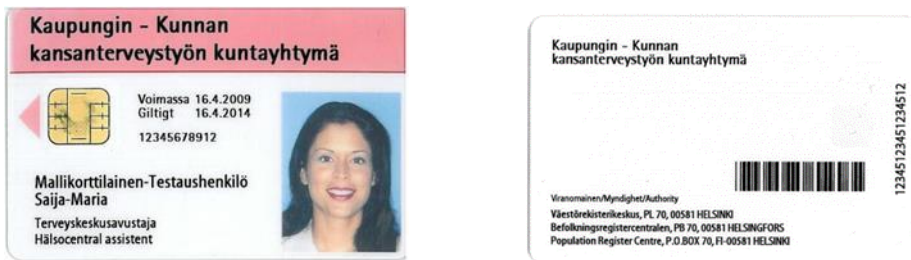
Kuva 2 Maksullinen sosiaali- ja terveydenhuollon toimijakortti