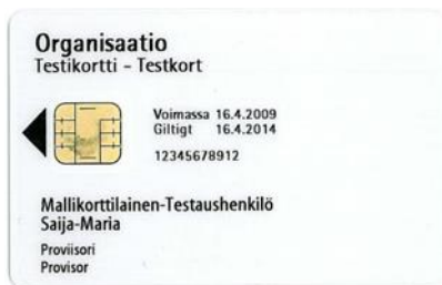
Kuva 3 Maksullinen sosiaali- ja terveydenhuollon testikortti

Maksullinen tilapäisvarmenne ladetaan sosiaali- ja terveydenhuollon varakortille Vartti tilaus- ja hallinnointijärjestelmän avulla online-yhteydellä. Laskutuksen perusteena on jokainen erillinen tilapäisvarmenteen lataus (varmennehaku) varakortille.