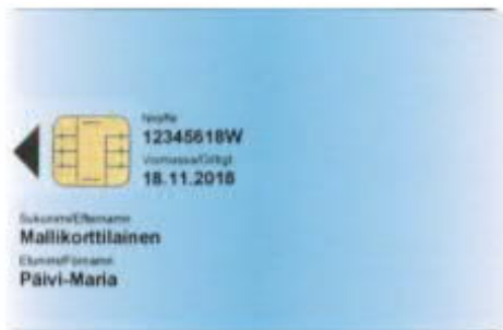
Kuva 13: Varmennekortti