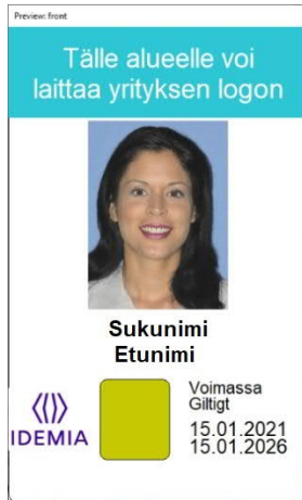
Kuva 7: Korttipohja 4 edestä