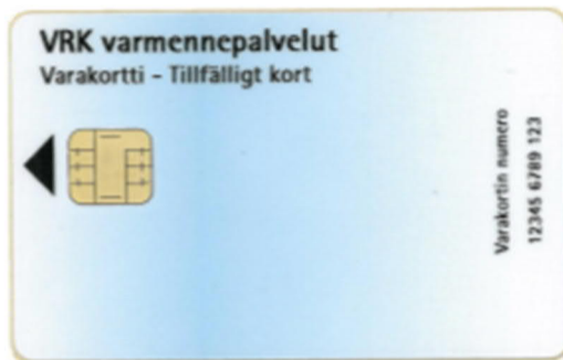
Kuva 15: Varakortti