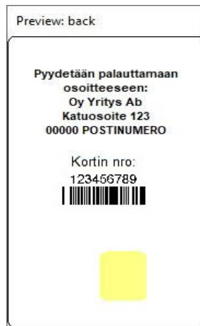
Kuva 8: Korttipohja 4 takaa