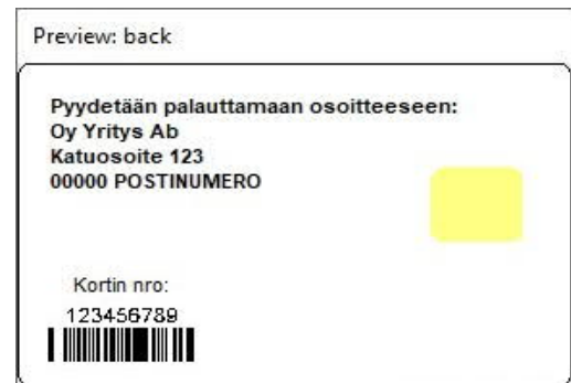
Kuva 4: Korttipohja 2 takaa