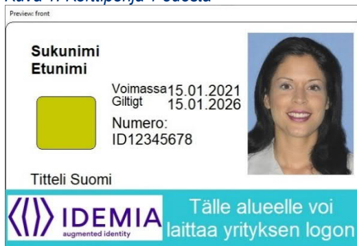
Kuva 3: Korttipohja 2 edestä