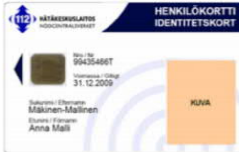
Kuva 12: Vakio-organisaatiokortti 2