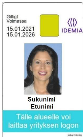
Kuva 9: Korttipohja 5 edestä