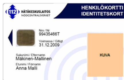
Kuva 1. Vakio-organisaatiokortti

Vakio-organisaatiokortin korttiaihion visuaalinen ulkoasu muodostuu liukuvan sinisestä tai valkoisesta pohjaväristä. Organisaation nimi sekä organisaation logo tulevat organisaatiokortin yläosaan. Organisaatiokortin etupuolelle tulevia tekstin ns. ohjaukenttiä ovat kortin sarjanumero, viimeinen voimassaolopäivä, sukunimi ja etunimi sekä valinnaisena saatavissa oleva kenttä, johon voidaan laittaa organisaatio, organisaatioyksikkö tai toimenkuva. Kortti voi olla kuvallinen tai kuvaton. Henkilön kuva sijoitetaan oikeaan laitaan. Vakio-organisaatiokortti on saatavissa myös pystymallina. Vakio-organisaatio-kortti tuotetaan kokonaisuudessaan pintatulostustekniikalla.