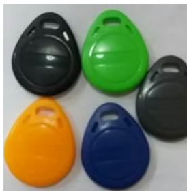
Kuva 1. Avaimenperä

Tuotteet tilataan suoraan valmistajalta. Tilauslomake sekä hinnasto ovat tämän kirjeen liitteenä.