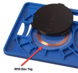
Kuva 3. Korttikotelo