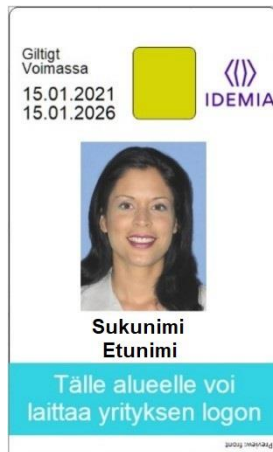
Kuva 9: Korttipohja 5 edestä