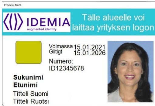
Kuva 1: Korttipohja 1 edestä