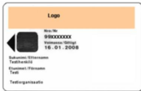
Kuva 11: Vakio-organisaatiokortti 1