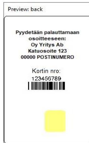
Kuva 8: Korttipohja 4 takaa