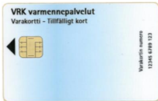
Kuva 15: Varakortti