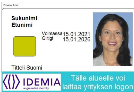
Kuva 5: Korttipohja 3 edestä