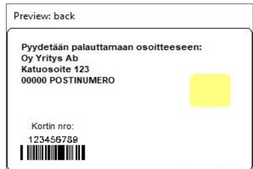
Kuva 6: Korttipohja 3 takaa