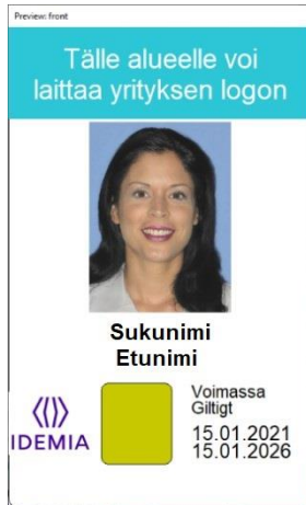
Kuva 7: Korttipohja 4 edestä