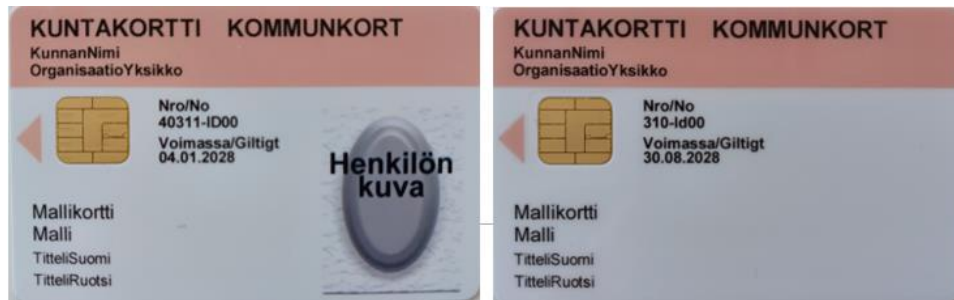
Kuva 14: Kuntakortti kuvallisena ja kuvattomana

Kuntakortti on kunnille tarkoitettu vaakakortti, joka voi olla joko kuvallinen tai kuvaton.