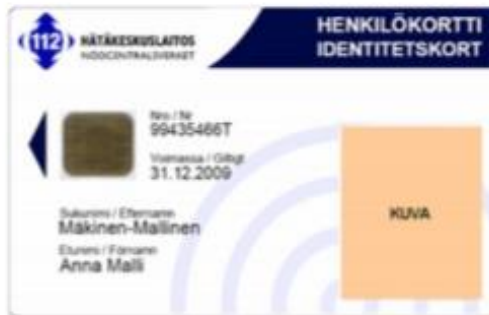
Kuva 12: Vakio-organisaatiokortti 2