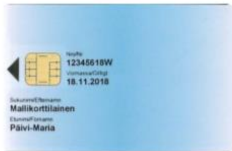
Kuva 13: Varmennekortti